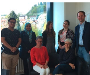
»Meet the Boss«