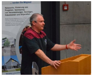
Vorträge und Vortragsreihen