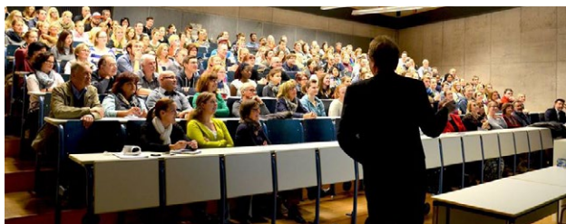
»Hochschule im Gespräch«